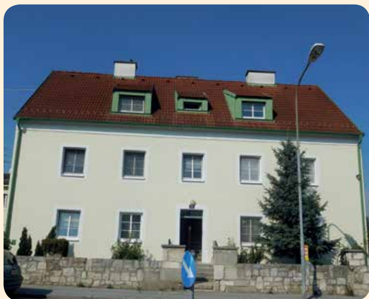
Neue Fenster und Fassade im Innenhof der alten Volksschule

In der Hintausstraße wurden die Fassaden der Gemeindewohnhäuser erneuert. Damit sind die Fassadenarbeiten aller unserer Gemeindewohnhäuser Bachgasse und Hintausstraße abgeschlossen. In der Hintausstraße sind noch Sanierungsarbeiten in den Stiegehäusern geplant